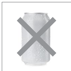
NG演出した画像 水滴、湯気、光などの過度な演出