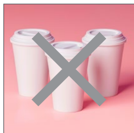
NG背景 色付きの背景