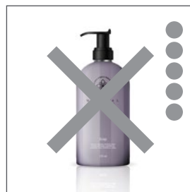
NG背景 背景に文字やロゴを入れる