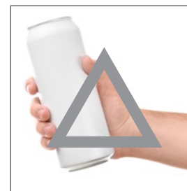
NG演出した画像 人や身体が入っている