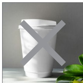
NG演出した画像 対象作品以外の物が写っている